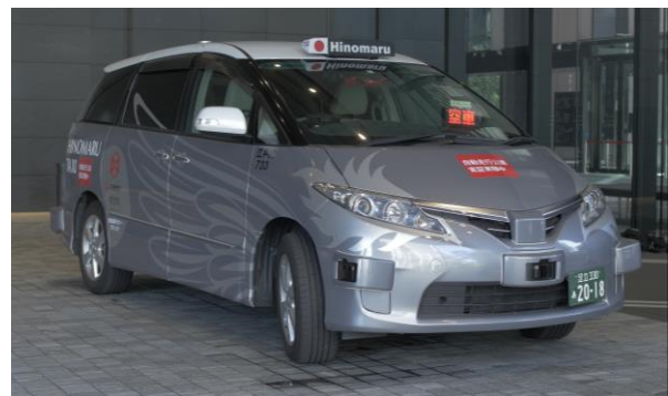
自動運転タクシー

両社は、本実証実験の成果を踏まえ、自動運転タクシーの実用化を目指して技術及びサービスの検証を進めてまいります。