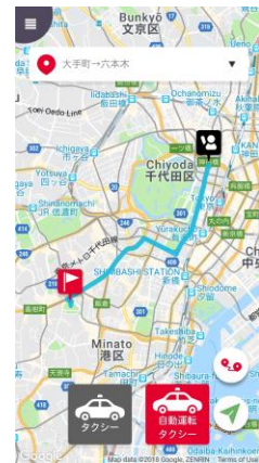
スマホアプリ画面