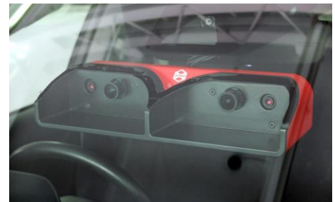
ステレオカメラ RoboVision®3(ケース付き)

本製品は、価格は 220 万円(税抜)で本日より受注を開始、12 月より納品を開始いたします。