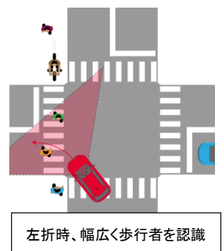
左折時、幅広く歩行者を認識