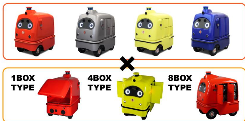
カラーラインナップ(上段) 荷台形状(下段)

本システムでは自律移動技術を搭載した CarriRo ® Deli 本体、遠隔監視・操作システム、店舗用アプリ、お客様用アプリ、および配送マネジメントシステムで構成され、更にパートナー側のシステムと連携することも可能です。また、機体のカラーは4色(レッド、シルバー、イエロー、ブルー)、荷台形状はスマートキー付き宅配ボックスを3タイプ(1、4、8 ボックス)から用途に応じて選択いただけます。