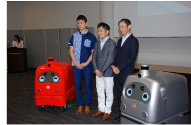
宅配ロボット CarriRo Deli (キャリロデリ) 記者発表