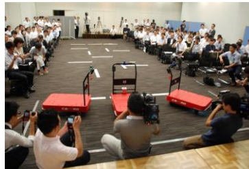
物流支援ロボット CarriRo (キャリロ) 記者発表