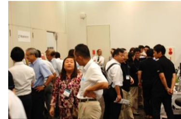
スポンサーブースの様子

ZMP は、世の中の技術開発の加速に貢献したいとの想いで、2009 年より ZMP フォーラムを毎年開催してまいりました。2019 年はロボット・自動運転技術の実用化・量産化により、社会課題やお客様の課題解決に実際に貢献したいという思いで、内容をバージョンアップし、ZMP World 2019 として開催いたします。テーマを、『R&D から量産化へ -ZMP が起こすロボリユーション-』とし、2019 年 7 月 23 日(火)から 26 日(金)までの 4 日間開催いたします。テーマ中にあるロボリユーション(Robolution)は、ロボット(Robot)技術を使って、楽しいライフスタイルを創る！(Creation)、新しいもので革新する！(Revolution)、既存のものを刷新する！(Innovation)、問題を解決する！(Solution)を組み合わせた ZMP のビジョンを示す造語です。