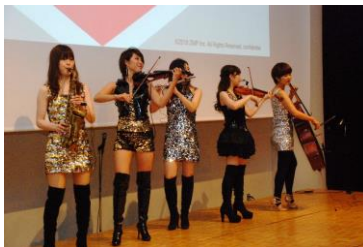
懇親会の様子 (エンターテイメント)