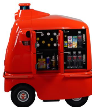
宅配ロボット CarriRo ® Deli 8BOXタイプ サイドビュー

8ボックスタイプのボックスサイズは幅220 x 奥行245 x 高さ169mmと、ペットボトル500mlが約10本収納可能なサイズで、コンビニ弁当、サンドイッチ、お菓子、スイーツなども運搬でき、コンパクトなボックスながら実用的な収納性を実現しております。