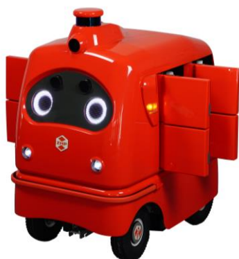
宅配ロボット CarriRo ® Deli 8BOXタイプ外観