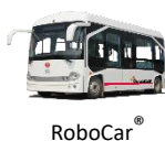
RoboCar® Mini EV Bus