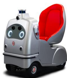
移動のパートナー Robocar® Walk (ロボカーウォーク)