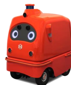
宅配ロボット CarriRo® Deli (キャリロデリ)