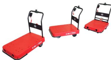
物流支援ロボット CarriRo® (キャリロ)